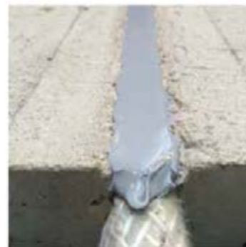
Technický detail č. 2: Použití provazce FJ203, lepidla na silikátové bázi FO142/3 a silikonu FS703 pro zajištění voděodolnosti: EI240