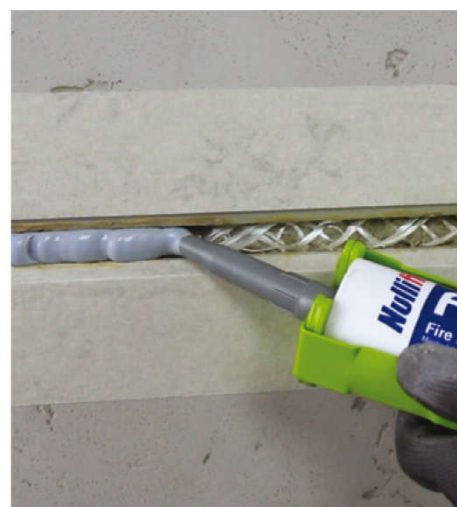
Spáru můžete poté podle potřeby utěsnit pomocí Nullifire FS702, FS703 nebo illbruck SP525.