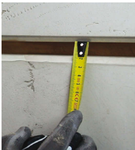
Zjistěte šířku spáry.