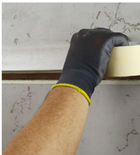
Oblepte okraje spáry.