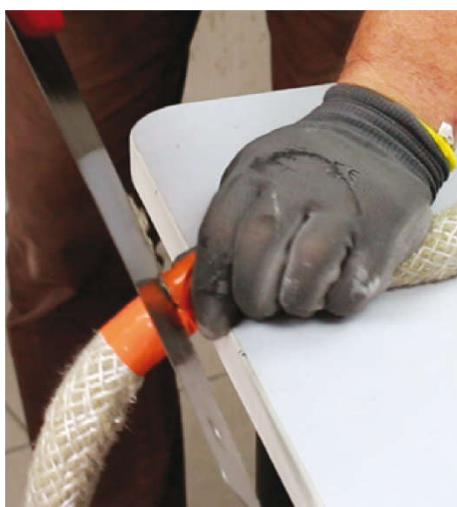
Uřízněte šňůru Nullifire FJ203.