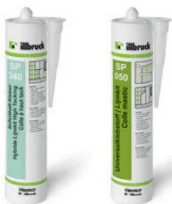
Lepidlo pro předsazená okna illbruck SP340 Lepicí tmel illbruck SP050

illbruck AT140 zlepšuje a optimalizuje stav podkladních ploch, na které jsou následně použity např. materiály SP340 a SP050. Impregnace je určena pro savé a pórovité podklady.