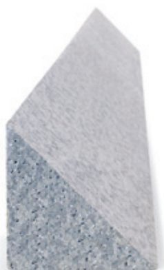
Zateplovací profil pro předsazená okna illbruck PR008

Inovativní nosný profil pro předsazenou montáž okna illbruck PR007 je vyroben z vysoce mechanicky zatížitelného materiálu, který umožňuje optimální připevnění a utěsnění oken v izolační rovině.