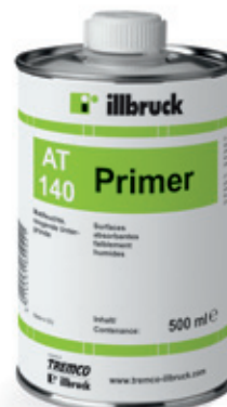
Primer pro savé podklady illbruck AT140

illbruck PR008 slouží ke kompletaci detailu, zakrytí hlav šroubů a optimalizuje tepelně izolační vlastnosti systému.