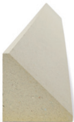
Nosný profil pro předsazená okna illbruck PR007

Inovativní nosný profil pro předsazenou montáž okna illbruck PR007 je vyroben z vysoce mechanicky zatížitelného materiálu, který umožňuje optimální připevnění a utěsnění oken v izolační rovině.